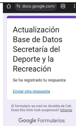
Evidencia de la actividad: (4)

Descripción breve: Asistí a la mesa de trabajo convocada por la coordinación de trabajo donde se llevó a cabo la orientación de las cuentas de cobro, con el propósito de mejorar la elaboración, redacción, organización de soportes y demás anexos.