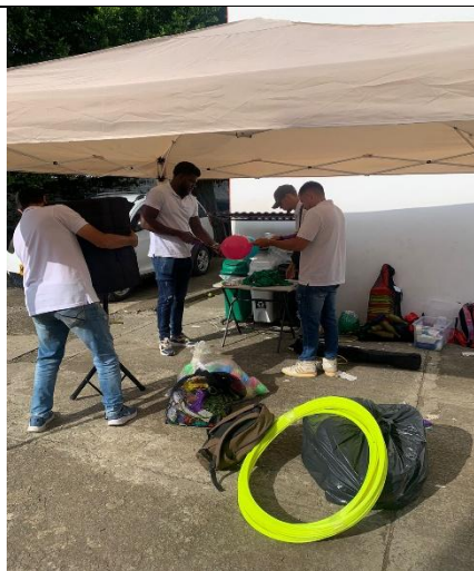
Evidencia de la actividad: (2)

Descripción breve: Organicé y compartí los documentos solicitados para la contratación de nueva vigencia, teniendo en cuenta las recomendaciones dadas por la supervisión, de igual manera, apoyé en la elaboración de cuenta de cobro para el mes estipulado cumpliendo con las directrices de la Secretaría.