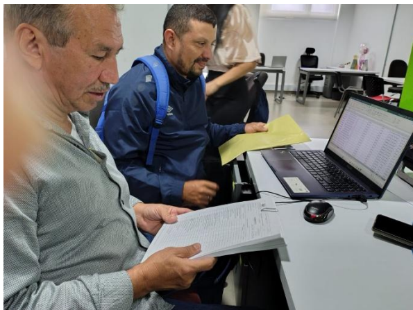
Evidencia de la actividad: (1)

Descripción breve: Organicé y compartí los documentos solicitados para la contratación de nueva vigencia, teniendo en cuenta las recomendaciones dadas por la supervisión, de igual manera, apoyé en la elaboración de cuenta de cobro para el mes estipulado cumpliendo con las directrices de la Secretaría.